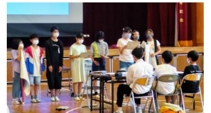
各校での取り組みを発表し合っ学び合う