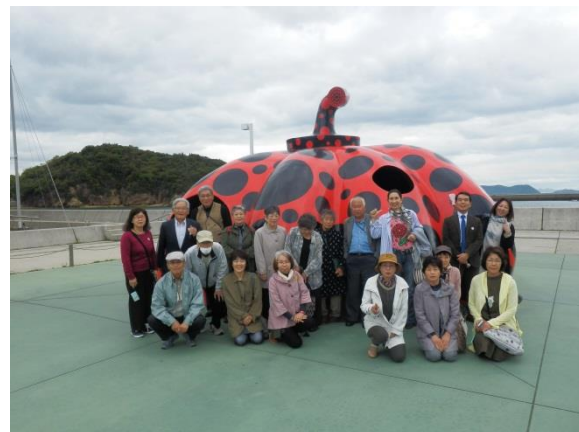
4/25「直島と地中美術館」