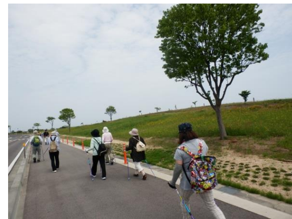
5/16「ノルディック・ウォーキング」