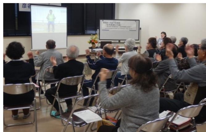
介護予防講座『在宅医療と介護』 ～要介護・要支援の違い、施設の種類と仕組み～

今年度の彦名ふれあい大学が4月19日(木)開講しました。 途中からの受講もできますので、お気軽にご参加ください。