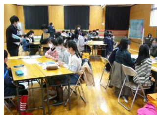
中学生が司会をして あいさつと言葉について グループ討議