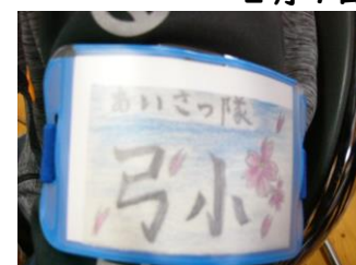
弓ヶ浜小の あいさつ隊腕章