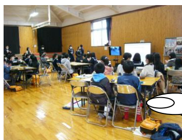
グループ討議のまとめを 小学生が発表