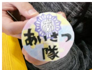
彦名小の あいさつ隊バッジ