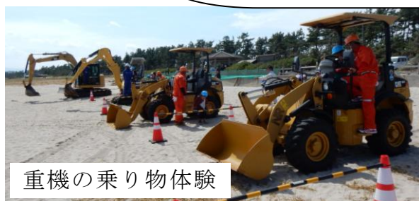
重機の乗り物体験