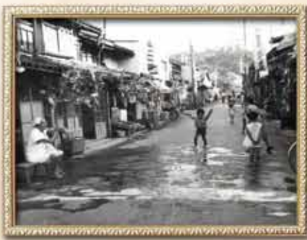
昭和42年の内町の七夕祭り「内田克巳写真集 米子より」