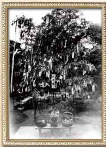
後藤家の七夕飾り「新修市史第13巻より」