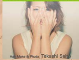
Hair Make & Photo Takashi Saito