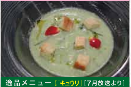
逸品メニュー 『キュウリ』[7月放送より]