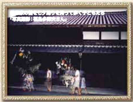
後藤家の前を七夕飾りを持って歩く子供たち

詳しくは番組をご覧ください！ 8月24日 放送スタート! 121ch 「内町の七夕祭り」