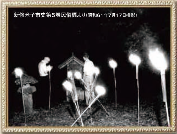
新修米子市史第5巻民俗編より(昭和61年7月17日撮影)