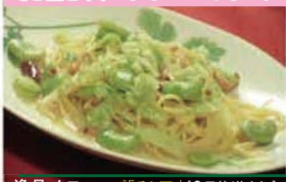
逸品メニュー「そら豆」[6月放送より]