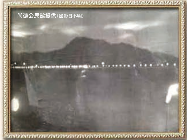
(撮影日不明)