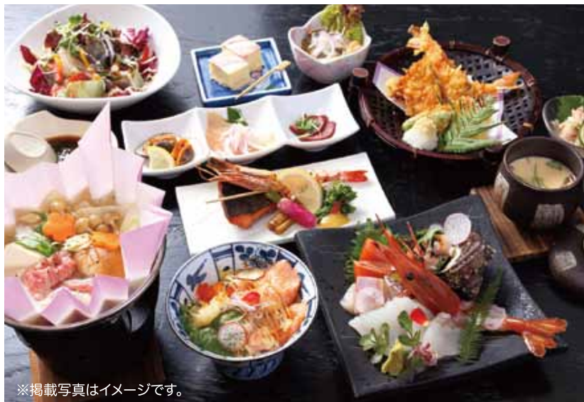
※掲載写真はイメージです。

日本海の幸をふんだんに使用した海鮮料理や、「地」の食にこだわった和食などを豊富に取り揃えるお店。夜も一品料理など、お酒にも合う料理が揃う。2階の座敷は個室や広間の貸し切りが可能で、団体や家族でも楽しめる空間がうれしい。