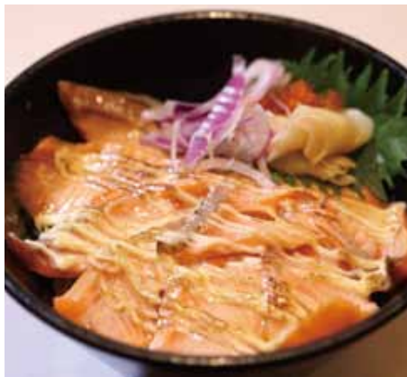
●炙りキングサーモン丼 ..... 800円

日本海の幸をふんだんに使用した海鮮料理や、「地」の食にこだわった和食などを豊富に取り揃えるお店。夜も一品料理など、お酒にも合う料理が揃う。2階の座敷は個室や広間の貸し切りが可能で、団体や家族でも楽しめる空間がうれしい。