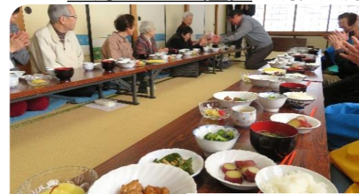
3月の給食サービスの様子