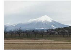
校門から望む大山

明けましておめでとうございます。平成30年がスタートしました。旧年中は本校教育のためにご支援・ご協力をいただきありがとうございました。あらためまして、