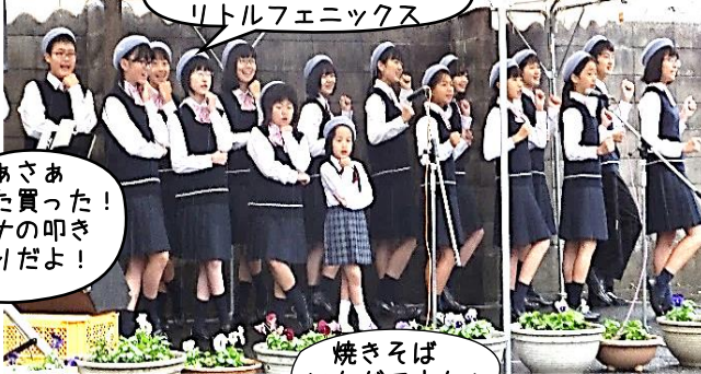
山陰少年少女合唱団 リトルフェニックス