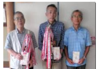
車尾囲碁・将棋同好会