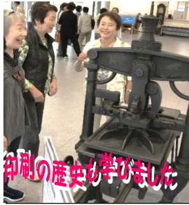
印刷の歴史を学びました