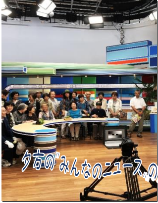
夕方のみんなのニュースのスタジオ

9月21日、出雲市の『しんぶん学聞館』(山陰中央新報製作センター)と『TSK山陰中央テレビ』に行きました。どちらも新しい施設で、みなさん興味深々!とてもおもしろかったです!アナウンサーさんにも会うことができました。来年の現地学習もお楽しみに!