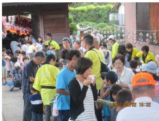
大人も負けじと挑戦です