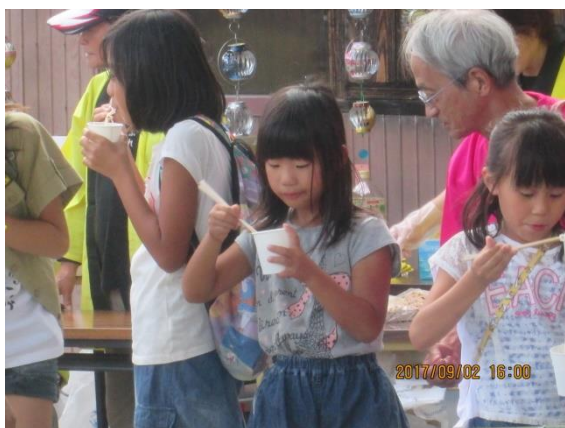
まず、そうめん流しに子ども達が挑戦です

今年の車尾ふれあい祭りは、実行委員会方式で「オール車尾」のにぎわいを創出すべく、9月2日（土）の午後、実施しました。住民だけの発想で「地域の老若男女問わず気兼ねなく集い・楽しみ・会話し・知り合い・地域の仲間意識を醸成する機会とする。」ことを目的に協議を重ねました。2回目と言うこともあり協議を重ねて準備をしてきました。そして当日、台風15号の心配も消え、オープニングのそうめん流しはあっという間に子どもの行列ができました。また露店も10店以上で大盛況でした。さらに地域で、アルミ缶を材料に「エコ風鈴」作成グループが、会場を一周する数百個飾って雰囲気盛り上げてくれました。特設ステージではカラオケ大会やマジックショー、フラダンスなど多彩の発表があり、フィナーレの午後7時過ぎからの福引き大抽選会には券を持って数百名が待ち構え、数字を読み上げられると歓声が上がり最後まで賑わいだ祭りでした。