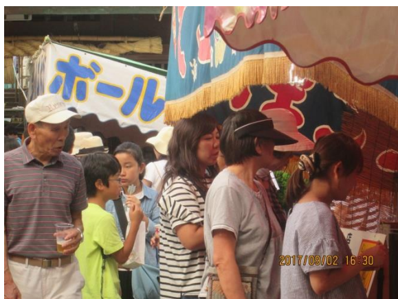
露店也大賑わいです