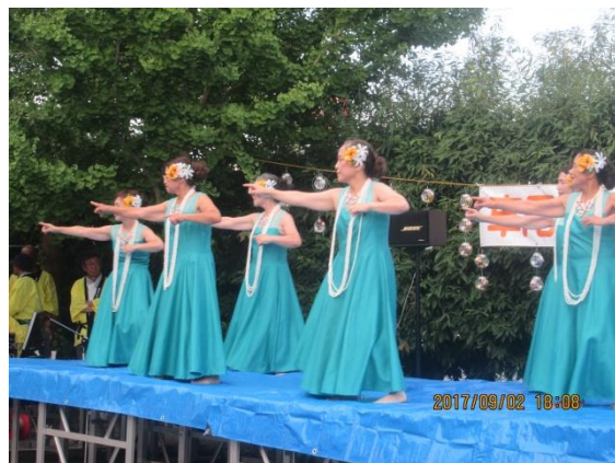
ステージの華、フラダンスで盛り上がりました

参加者の男性は「2回目ということですが実行委員がお揃いのハッピーで細やかに対応していて昨年以上に盛り上がりました。」