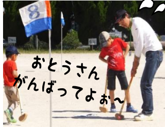
5月28日(日) 車尾小学校グラウンド