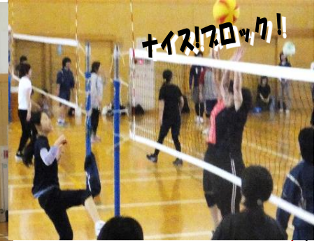
6月25日(日) 車尾小学校体育館