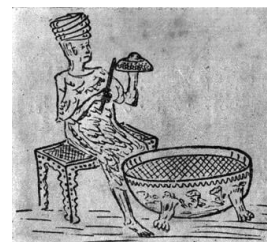
インドの水時計の番人

●募集要項は5月中頃各公民館へ配布します。 米子ものづくり道場 ☎38-6498