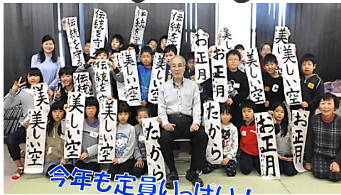
車尾地区青少年育成会