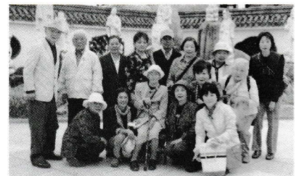
湯梨浜町の中国庭園燕趙園にて (平成27年5月3日)

また、研修旅行として社会福祉協議会のマイクロバスを利用して頂き、年2回程度出掛けています。行き先は近場ではありますが、皆と一緒に掛けられるということも楽しみのひとつとなっているようです。