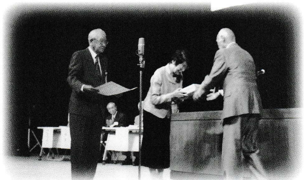
ダイヤモンド婚 おめでとうございます！