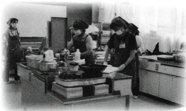
給食サービスでの調理風景 在宅福祉員のみなさん、ありがとうございます！