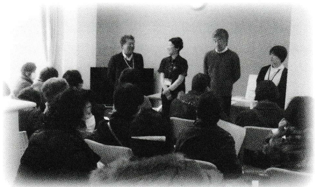
在宅福祉員研修会「にじの里おおたか」を見学しました