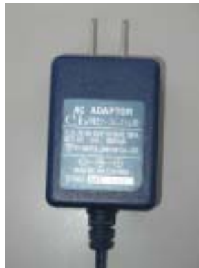
青色の電源アダプタ