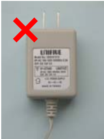
白色の電源アダプタ