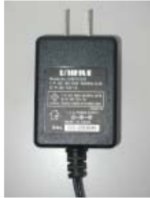
黒色の電源アダプタ