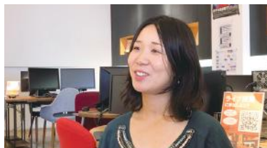
デジハリ発！地元クリエイター誕生秘話 「夢はジャズ喫茶でWebディレクター」

紙面ではお伝えしきれなかった、林原さんのインタビューがいつでも動画で見られます！