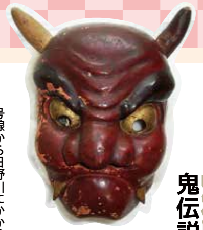
「大牛蟹の面（楽々福神社所蔵）」