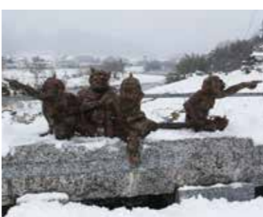
⑤ 鬼守橋 四方に10体の鬼のブロンズ像たちが鎮座、この橋を渡る人たちの邪気をいつの間にか、きれいさっぱり払ってくれるそう。