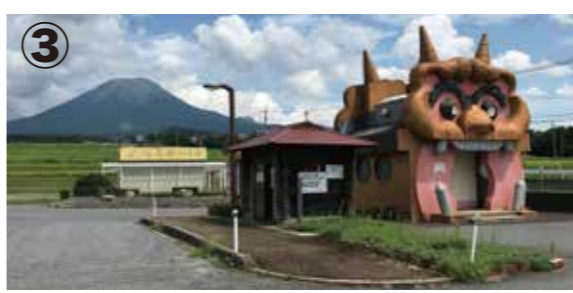
写真上／③鬼のトイレ 写真右／④鬼の電話ボックス

鬼退治に成功し、大いに喜んだ里人たちは、笹の葉で屋根を葺いた神社を作り、その一番の貢献者である孝霊天皇とその一族を祀ったのがこちらの古社。この神社は、日南町宮内の東楽々福神社・西楽々福神社と共に日野郡三楽々福神社に数えられ、日野大社と呼ばれる大変崇敬の篤い神社であると伝えられています。その名前からも、大きな福を呼ぼうと開運祈願に多くの人が訪れます。