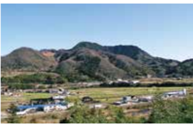
⑦ 笹苞山 鬼住山の南に位置する笹苞山（さすとさん）は、鬼退治のため、第七代孝霊天皇が陣を張ったとされる聖地。