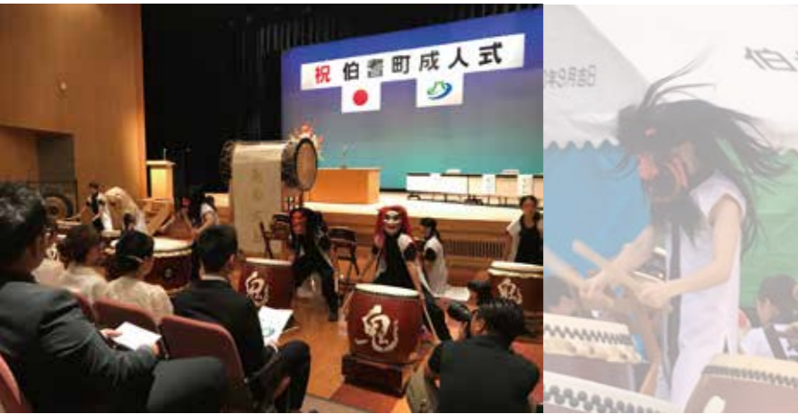
昨年夏に行われた伯耆町成人式での演奏