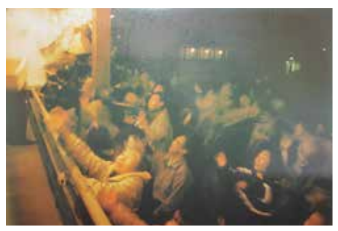
過去に行われた節分祭の様子

こちらの神社では、節分の恒例行事である豆まきを30年以上開催。地元の総代さんや、還暦を迎える年男・年女などの20名が境内にズラリと並び、一斉に豆まき(袋入り)を行う光景は、今では珍しいものとなった。福引きなども毎年人気で華やかな賑わいを見せる。