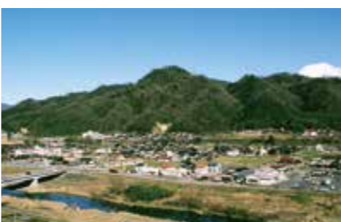
⑥ 鬼住山 鬼が居座っていたとされる鬼住山（きずみやま）。位置によってはおかめにも、また鬼の面にも見えるといわれる伝説の山です。標高326mの頂上から望む対面の大山は、周囲に障害物がなく格別のロケーション。散策道もあり、今は絶好のハイキングコースとして多くのレジャー客を集めています。