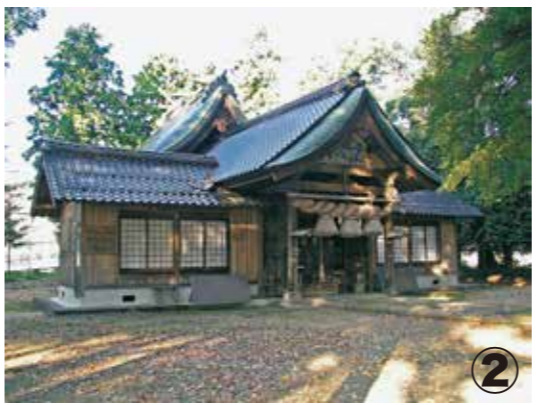
② 楽々福神社 伯耆町宮原

鬼退治に成功し、大いに喜んだ里人たちは、笹の葉で屋根を葺いた神社を作り、その一番の貢献者である孝霊天皇とその一族を祀ったのがこちらの古社。この神社は、日南町宮内の東楽々福神社・西楽々福神社と共に日野郡三楽々福神社に数えられ、日野大社と呼ばれる大変崇敬の篤い神社であると伝えられています。その名前からも、大きな福を呼ぼうと開運祈願に多くの人が訪れます。