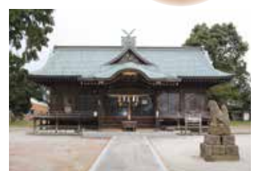
日御崎神社 境港市渡町 1487 番地 4 tel.0859-45-4095