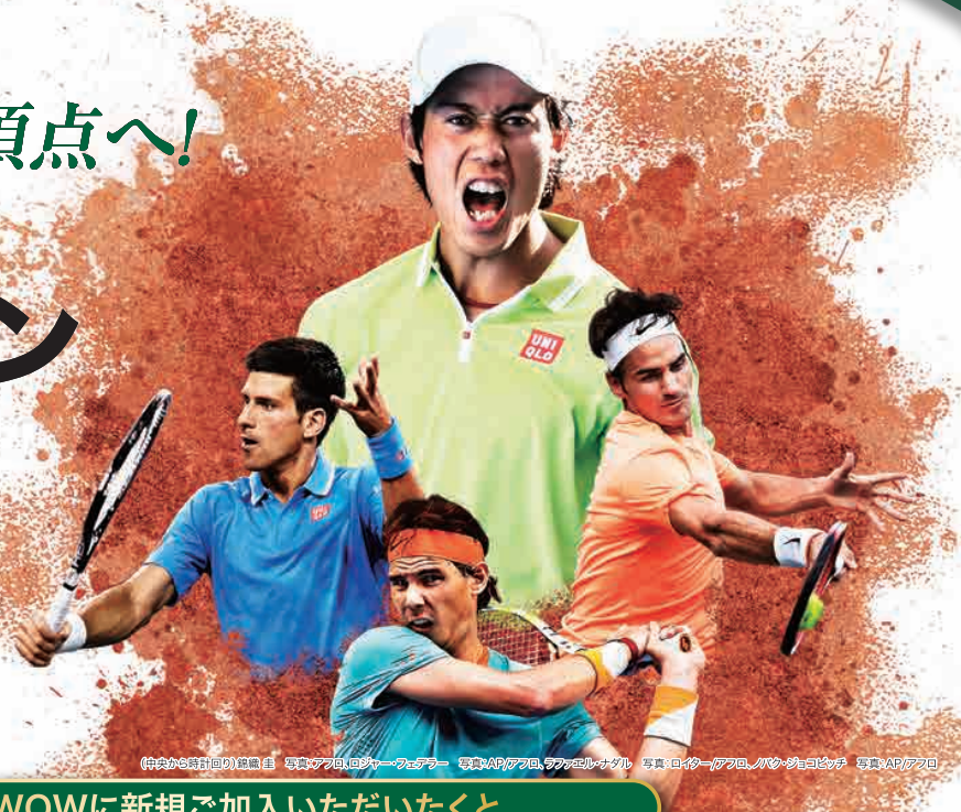
(中央から時計回り)錦織圭 写真AP/ロイター/アフロ 写真AP/アフロ、AFP/エル・ザウル 写真:ロイター/アフロ、バウ・ジヨビッチ 写真:AP/アフロ